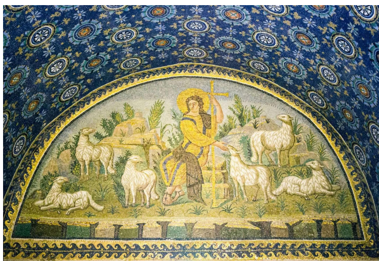
Mosaico del Buon Pastore 425 D.C. - MAUSOLEO DI GALLA PLACIDIA RAVENNA

Le mie pecore ascoltano la mia voce e io le conosco ed esse mi seguono. Io do loro la vita eterna. Giovanni 20,27-30