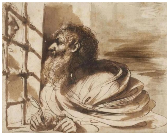
San Giovanni Battista in prigione visitato da Salomé