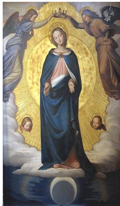
L'Immacolata Concezione di Maria